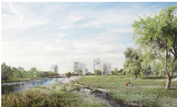
Projekt Hagnau, Muttenz Schänzli